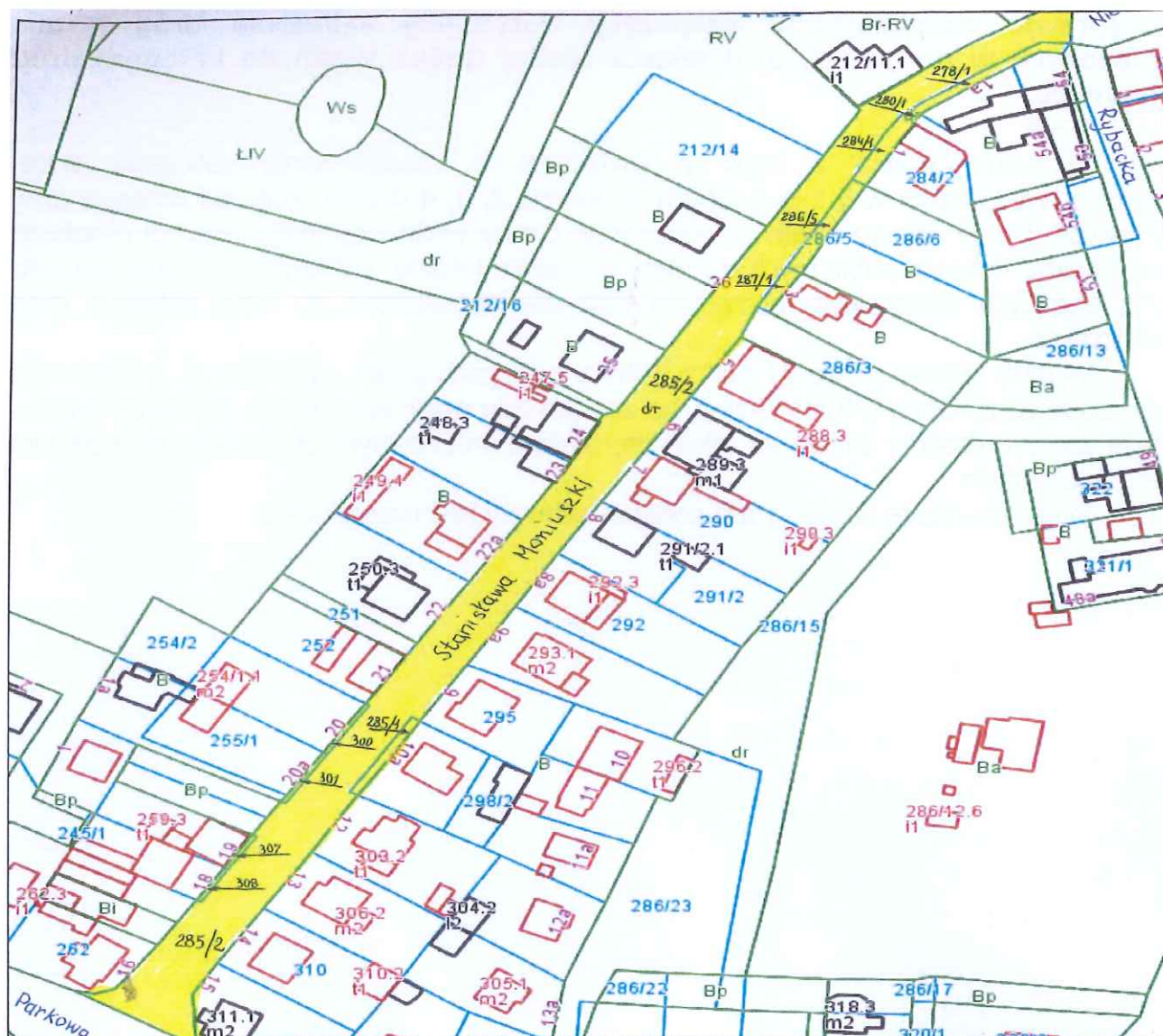
Wolin – ul. Stanisława Moniuszki