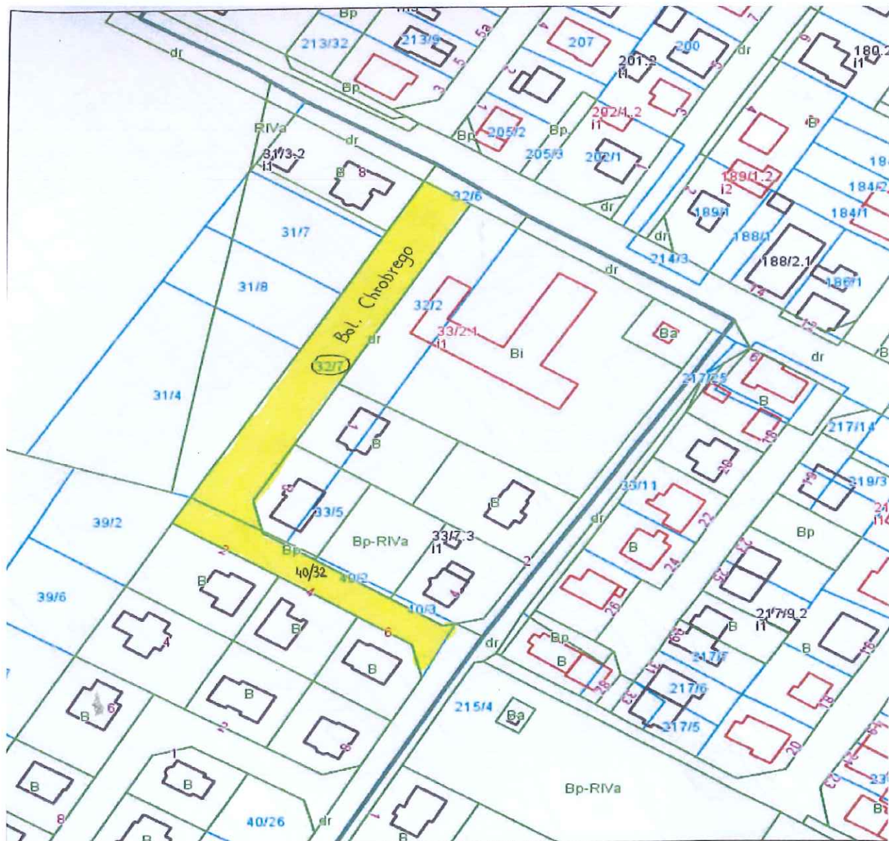
Wolin – ul. Bolesława Chrobrego