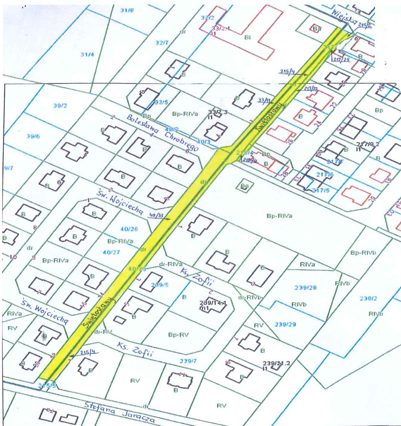
Wolin – ul. Świątosławy